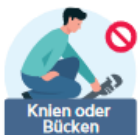
Knien oder Bücken

SIE SIND NICHT MEHR IN DER LAGE, MIT BEIDEN HÄNDEN WERKZEUG ODER BAUMATERIAL BIS ZU EINEM GEWICHT VON 5 KG (2 KG MIT EINER HAND) VON EINEM TISCH ODER EINER WERKBANK ZU HEBEN UND 5 METER WEIT ZU TRAGEN.