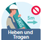
Heben und Tragen

SIE SIND NICHT MEHR IN DER LAGE, DEN LINKEN ODER DEN RECHTEN ARM BIS AUF SCHULTERHÖHE ZU HEBEN UND DORT 10 SEKUNDEN ZU HALTEN, UM Z.B. EINEN NAGEL EINZUSCHLAGEN ODER MALER- BZW. SPACHTELARBEITEN DURCHZUFÜHREN.